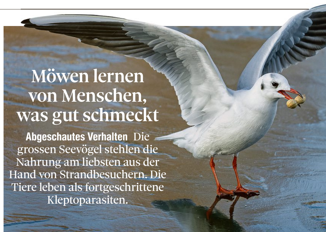
Die Bestände der Möwen nehmen in der Umgebung von Menschen zu.