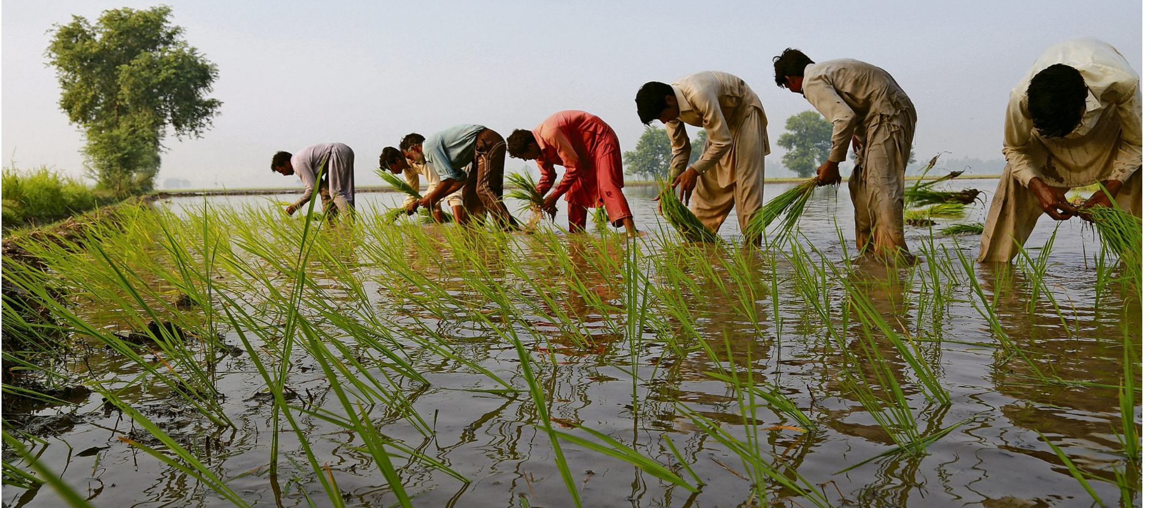
Mühsame Arbeit: Eine Gruppe Männer pflanzt in der pakistanischen Provinz Punjab Reissetzlinge.