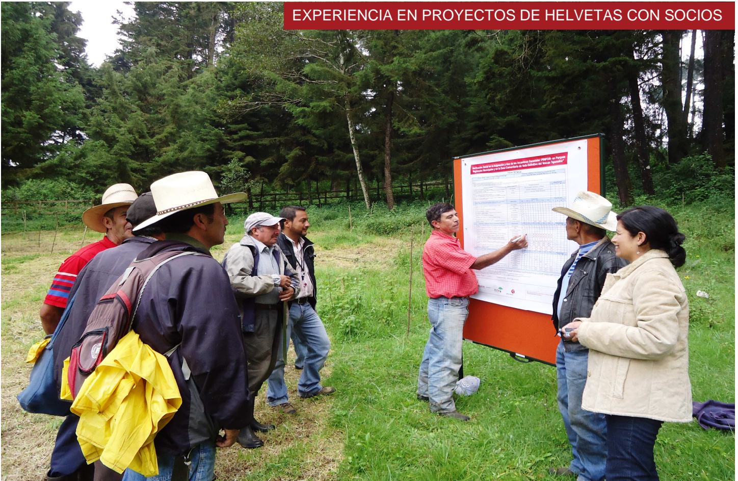
Arriba: Presentación de la Ficha Técnica de Verificación Social en el Bosque Municipal de Esquipulas Palo Gordo, San Marcos.