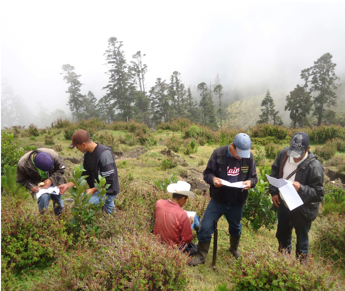
Arriba: Grupo verificador en el área del Proyecto de Manejo Forestal con Fines de Protección de 27.57 has, ejecutado en la Aldea Toninchun, Municipio de Tajumulco.